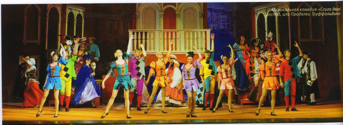
Музыкальная комедия «Слуга двух господ, или Прodelки Труффальдино»

Музыкальный театр завершает год тремя волшебными премьерами – мюзиклом по мотивам самого известного романа Шарлотты Бронте, ремейком «Приключений Буратино» и новой версией музыкальной комедии «Слуга двух господ, или Прodelки Труффальдино».