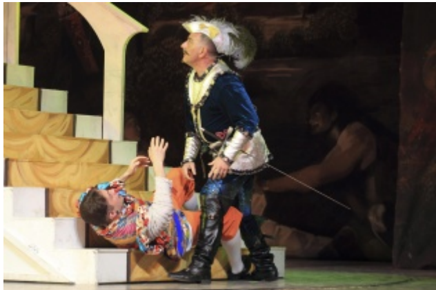
Собака на сене