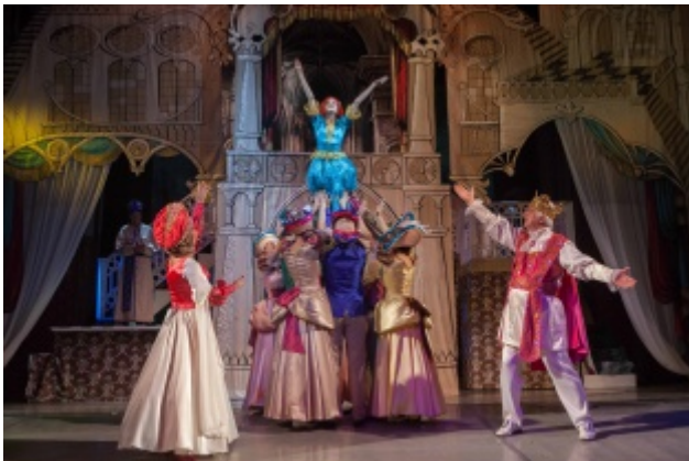
Спящая красавица, или Заклятие ведьмы Мортон