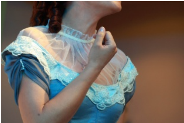
Беда от нежного сердца