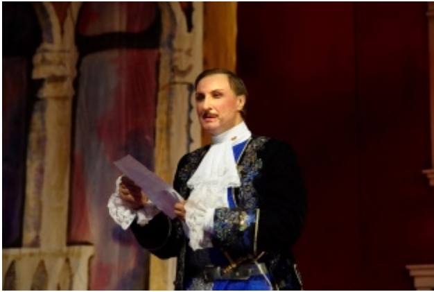
Слуга двух господ, или Прodelки Труффальдино