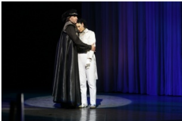
Дон Жуан в Севилье