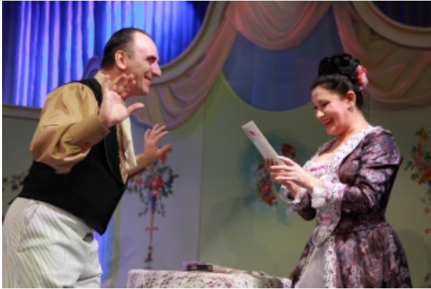
Беда от нежного сердца